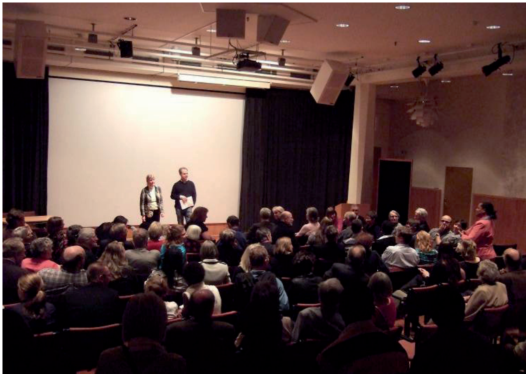
Photo from the gathering at the AGM in March.