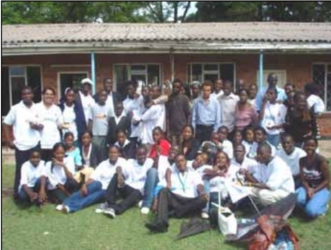
All 3 Youth Clubs gathered outside the Information Centre